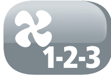
3 Fan speed settings