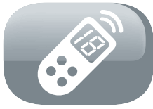
Remote control with LCD-display